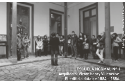
Fotografía: Josefina López