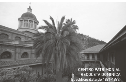
CENTRO PATRIMONIAL RECOLETA DOMINICA El edificio data de 1891-1897.