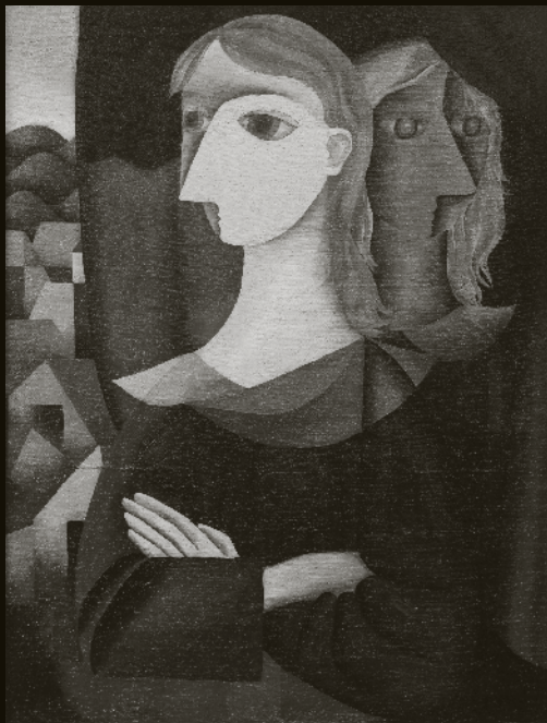
La juventud y vejez. 1950 Óleo sobre tela.

Muestra que reúne cerca de 90 obras del pintor chileno a 60 años de su temprana muerte. 50 óleos, 25 grabados, 15 acuarelas, témperas y dibujos, componen esta, la exposición retrospectiva más completa que se ha realizado de la obra de Carlos Faiz. Entre las obras se destaca un mural de más de 6 metros de largo, que nunca había sido expuesto, y la presencia de 4 óleos, un grabado y un dibujo pertenecientes a la Colección del Museo Nacional de Bellas Artes.