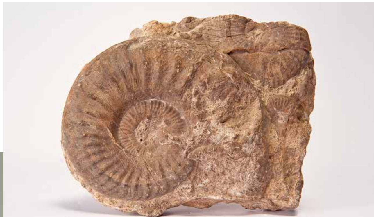
Fósil invertebrado de Sonninia sp., ammonites del Bajociano (Jurásico Medio).