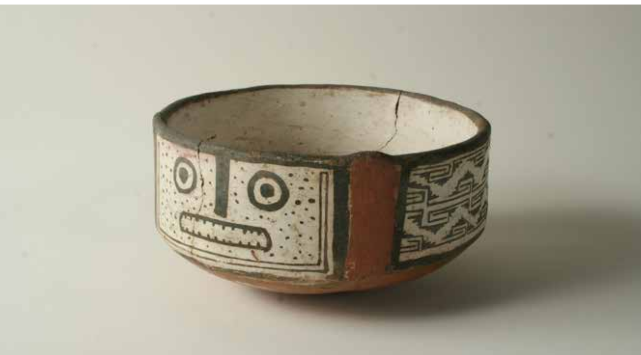
Plato "Puco" de cerámica decorado, Cultura Diaguita.