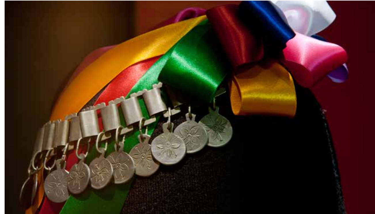
Tralilonko de plata, Cultura Mapuche (Periodo Histórico), Museo Regional de la Araucanía.