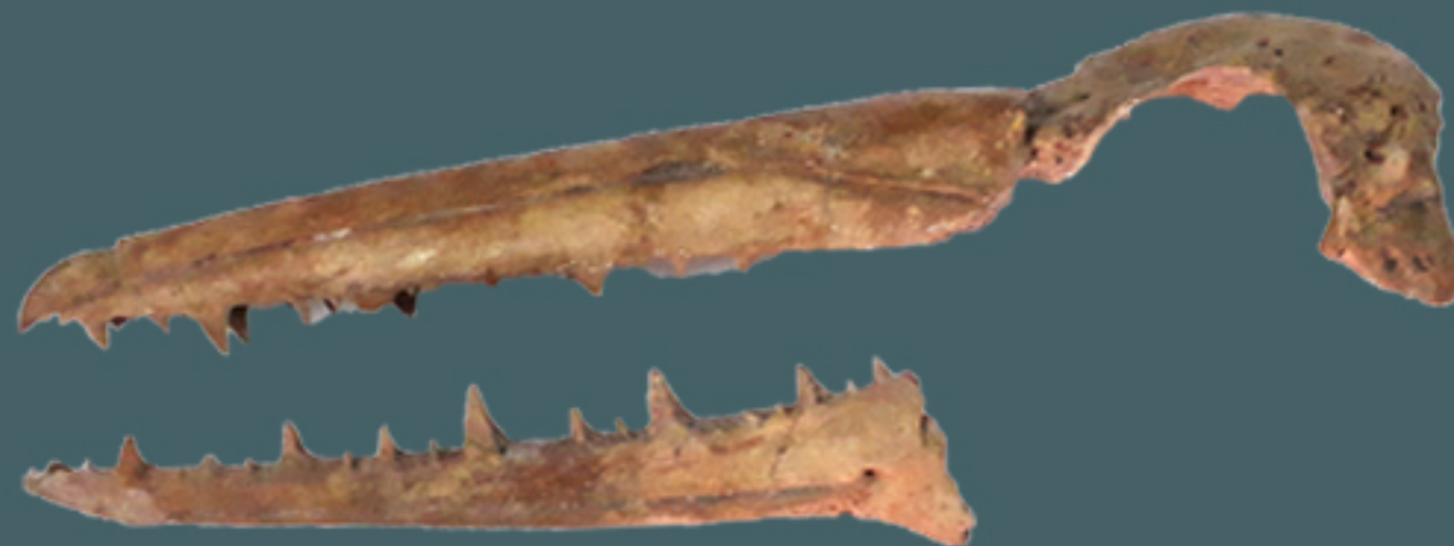
*Pelagornis chilensis. Repatriado en 2011 desde Alemania.