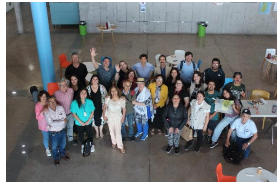
d) Cuarta reunión ampliada en Colegio Neandro Schilling de San Fernando, 22 abril 2024