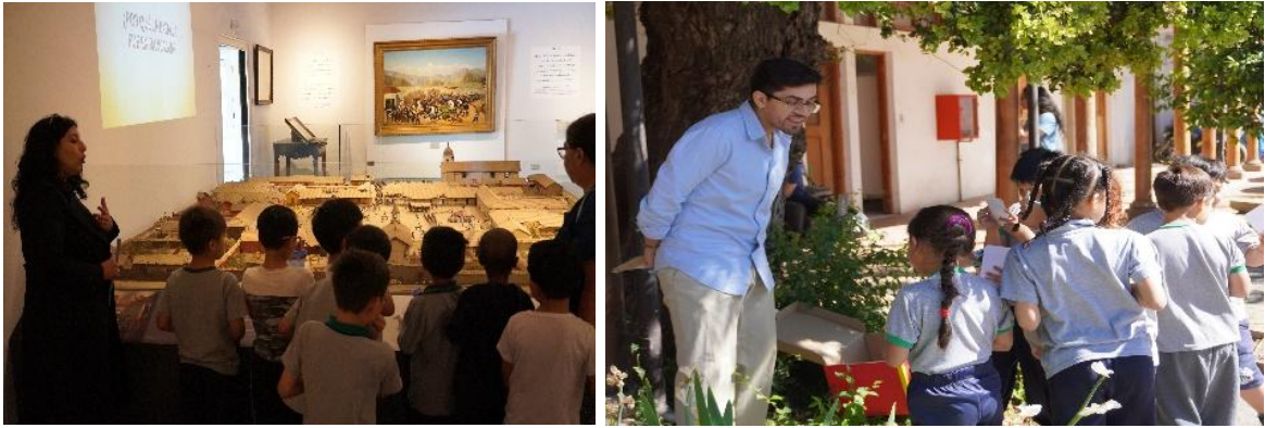
Registro fotográfico de la actividad educativa, proyecto de innovación SIG Regional